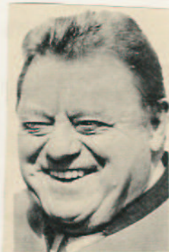
Franz Josef Strauß

Er konnte sich über dieses Thema nur ein müdes Lächeln abringen.