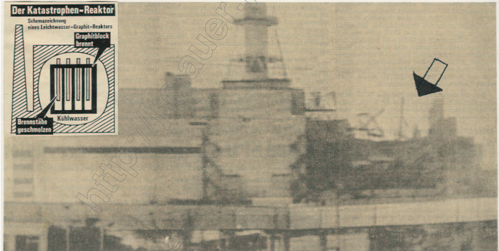
Der zerstörte Reaktor in Tschernobyl (der Pfeil zeigt die zerstörte Stelle)