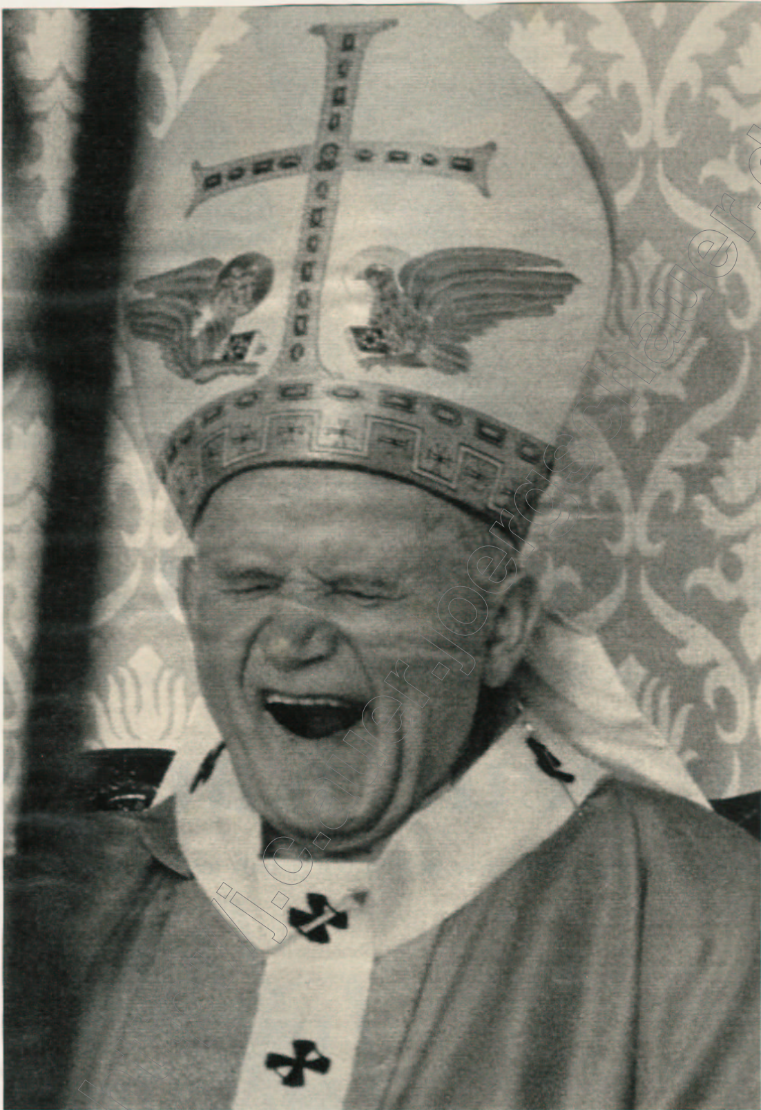
DER PAPST GAB SICH GELANGWEILT.